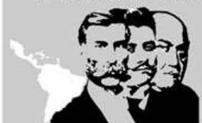
Felipe Varela (1821 - 1870) Manuel Ugarte (1875 - 1951) Arturo Jauretche (1901 - 1974)