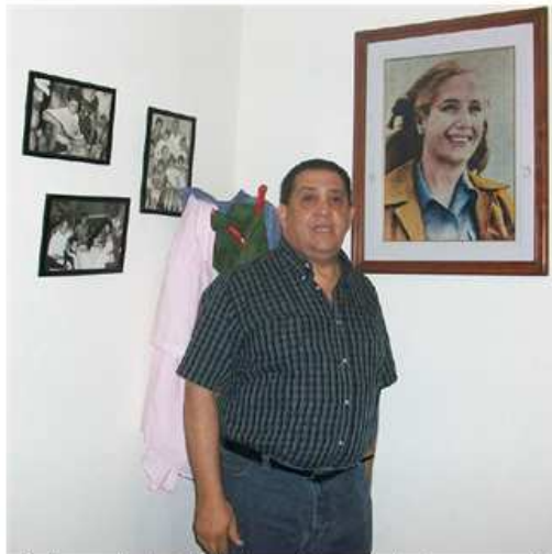
«No hay profundización de la agenda económica si no se aprueba la ley de Servicios de Comunicación Audiovisual»

- Muy complicado. Pero tengo fe que lo vamos a sacar adelante. Me parece que Kirchner tiene que abroquelar tras de sí todo el espectro que lo acompaña.