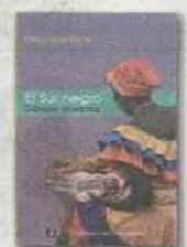
EL SUR NEGRO Crónicas afrolatinas. Pedro Jorge Solans