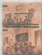
LA POLITICA UNIVERSITARIA DEL PRIMER PERONISMO Julián Andrés Dercoli