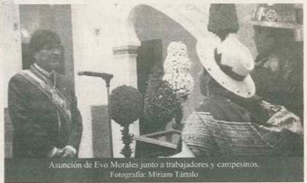
Asunción de Evo Morales junto a trabajadores y campesinos.

Logró, además, trascender su representación de los marcos de su propia militancia y de sus más fervientes adherentes. Desde su triunfo en 2006 ha acumulado políticamente de tal manera que se ha convertido en la figura ineludible para las grandes mayorías sociales (bien diversas social, económica y culturalmente), vinculado a una gran concientización política, a su elección de seguir recorriendo el camino del desarrollo económico nacional, de una