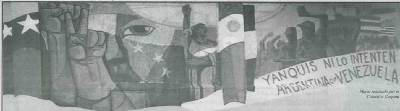
Mural realizado por el Colectivo Carpani

Comunicado de la Corriente Política E. S. Discépolo