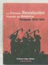
LA PRIMERA REVOLUCION EN AMERICA Richard Alan White