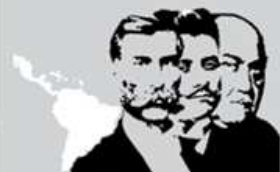
Felipe Varela (1821 - 1870) Manuel Ugarte (1875 - 1951) Arturo Jauretche (1901 - 1974)