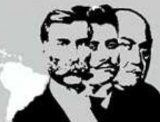
Felipe Varela (1821 - 1870) Manuel Ugarte (1875 - 1951) Arturo Jauretche (1901 - 1974)