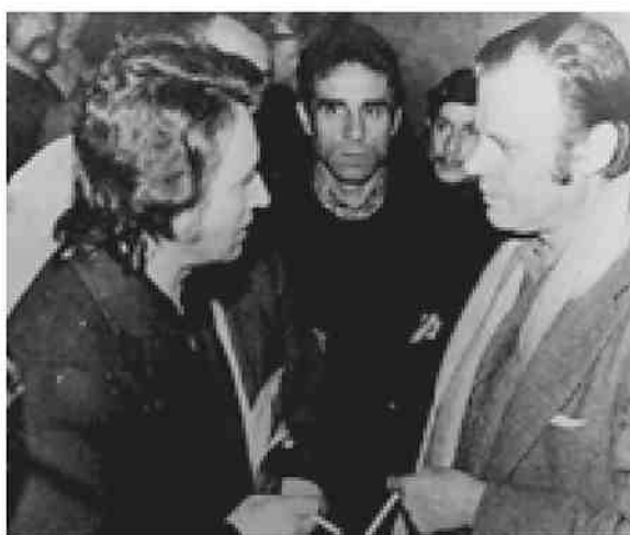
Ongaro de la CGT A y Agustín Tosco

A mediados de 1968 la CGT se divide: la CGT liderada por Alonso y Vandor, denominada "CGT Azopardo" y la "CGT de los Argentinos", dirigida por Raimundo Ongaro representante del peronismo de izquierda.