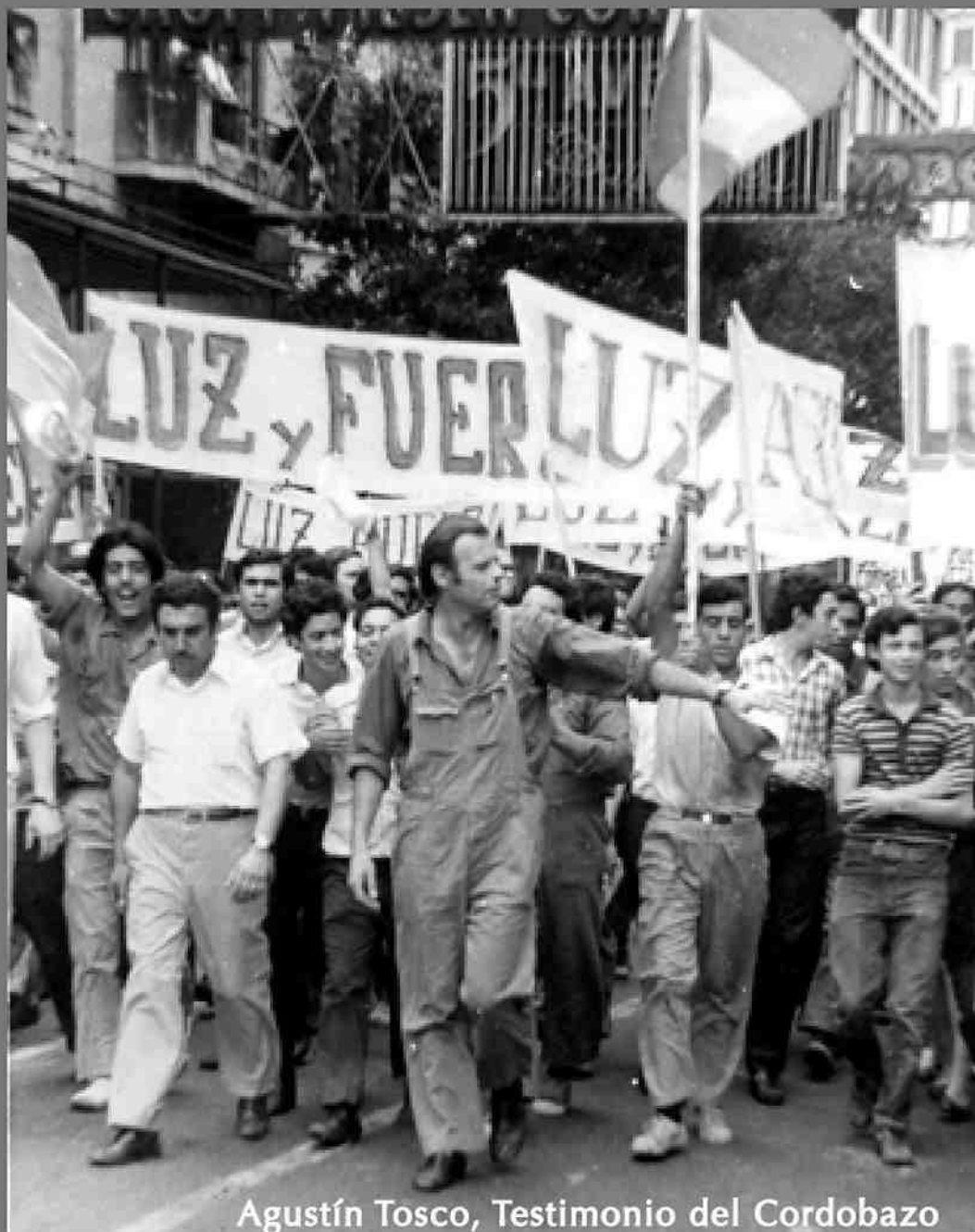
Agustín Tosco, Testimonio del Cordobazo