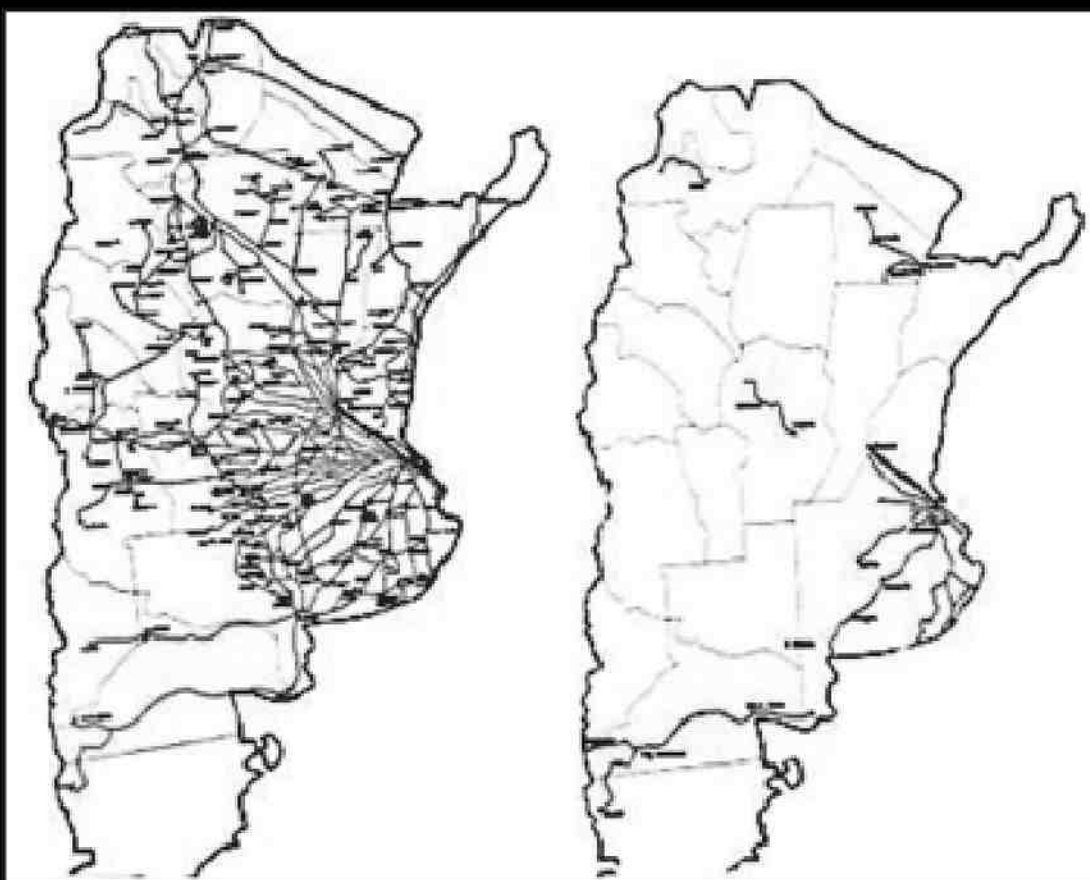
Gráfico que muestra el tendido ferroviario antes y después de las concesiones de la era menemista.

Con esta frase sentenció Carlos Menem a la red ferroviaria argentina, en 1989. Obediente a los principios del neoliberalismo, el estado no debía "soportar" gastos innecesarios, como por ejemplo sostener un servicio "improductivo". Pero el cierre de los ramales no sólo implicaba la pérdida de puestos de trabajo, sino el aislamiento y condena de cientos de pueblos que quedan aislados, sin comunicación ni medios de vida. Algunos ejemplos de esta desgracia: La Banda, Simbol, Loreto, Beltrán en Santiago del Estero, Laguna Paiva y San Cristóbal en Santa Fe, Navarro, Las Marianas en Buenos Aires, Pluma de Pato, Morillo en Formosa, Desiderio Tello, Carrizal, Patquía en La Rioja. Ciudades